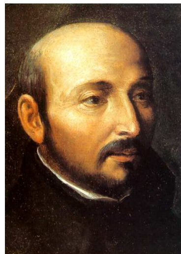
Sv. Ignác z Loyoly

V súčasnosti CVX pôsobí v takmer 60 krajinách po celom svete.