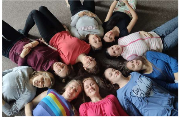
Z rannej modlitby tancom