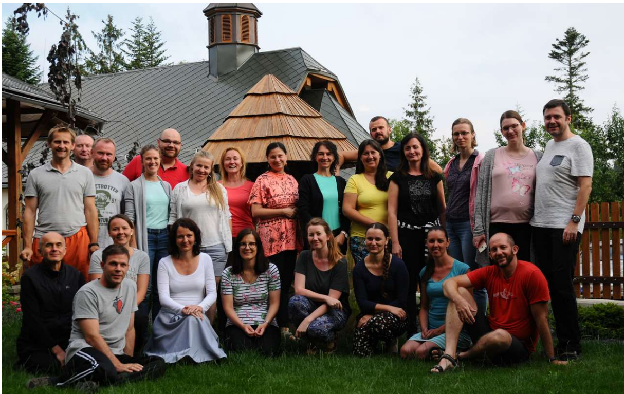
Účastníci duchovných cvičení, Klokočov, júl 2021