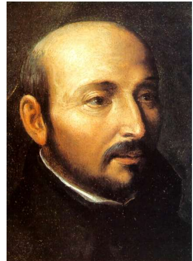
Sv. Ignác z Loyoly