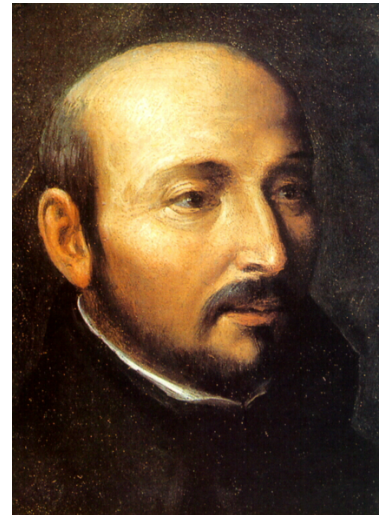
Sv. Ignác z Loyoly

V súčasnosti CVX pôsobí v takmer 70 krajinách po celom svete.